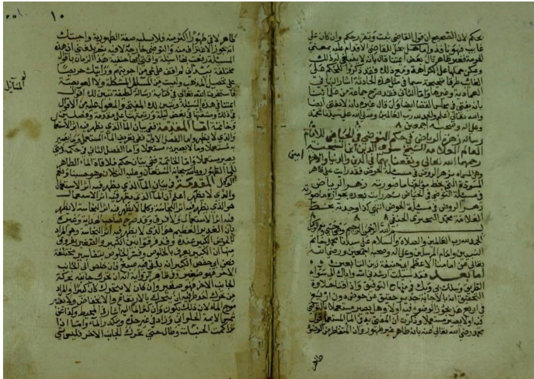
صورة اللوحة الأخيرة من نسخة (م)