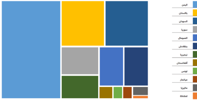
الشكل رقم (٢): أعلى الدول تلقياً للمساعدات في العام ٢٠٢١ م.

كما تظهر الإحصائيات الصادرة عن المركز أن قطاع الأمن الغذائي استفاد من ١٢١ مشروعاً بقيمة تقارب ٤٠١ مليون دولار أمريكي في حين استفاد قطاع الصحة من ١٦٥ مشروعاً بقيمة قرابة ١٠٤ مليون دولار أمريكي كما هو موضح في الجدول رقم (١٣).